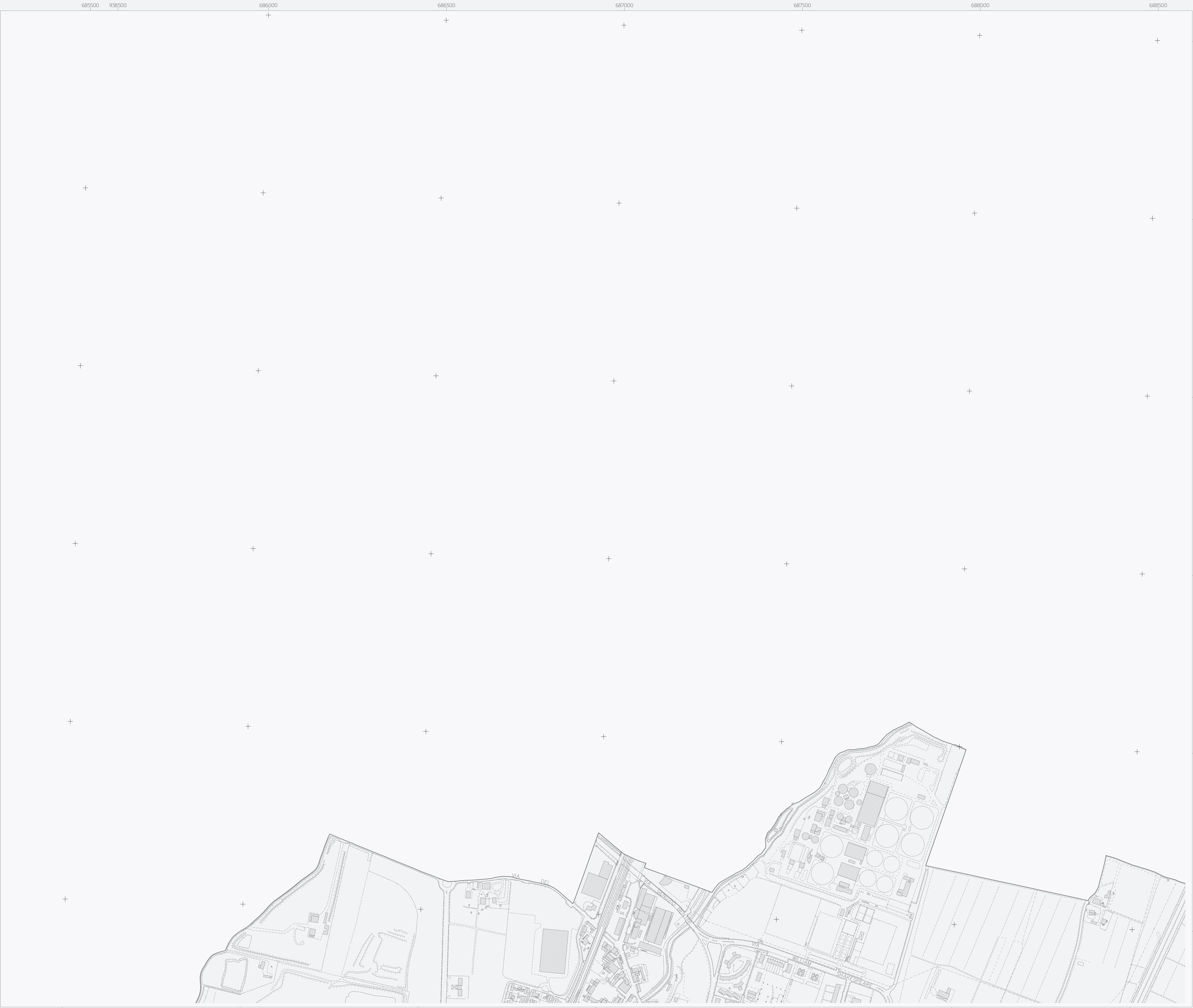
La tavola CTC n. 3 rappresenta l'elemento 221013 della Carta Tecnica Regionale 1:5.000