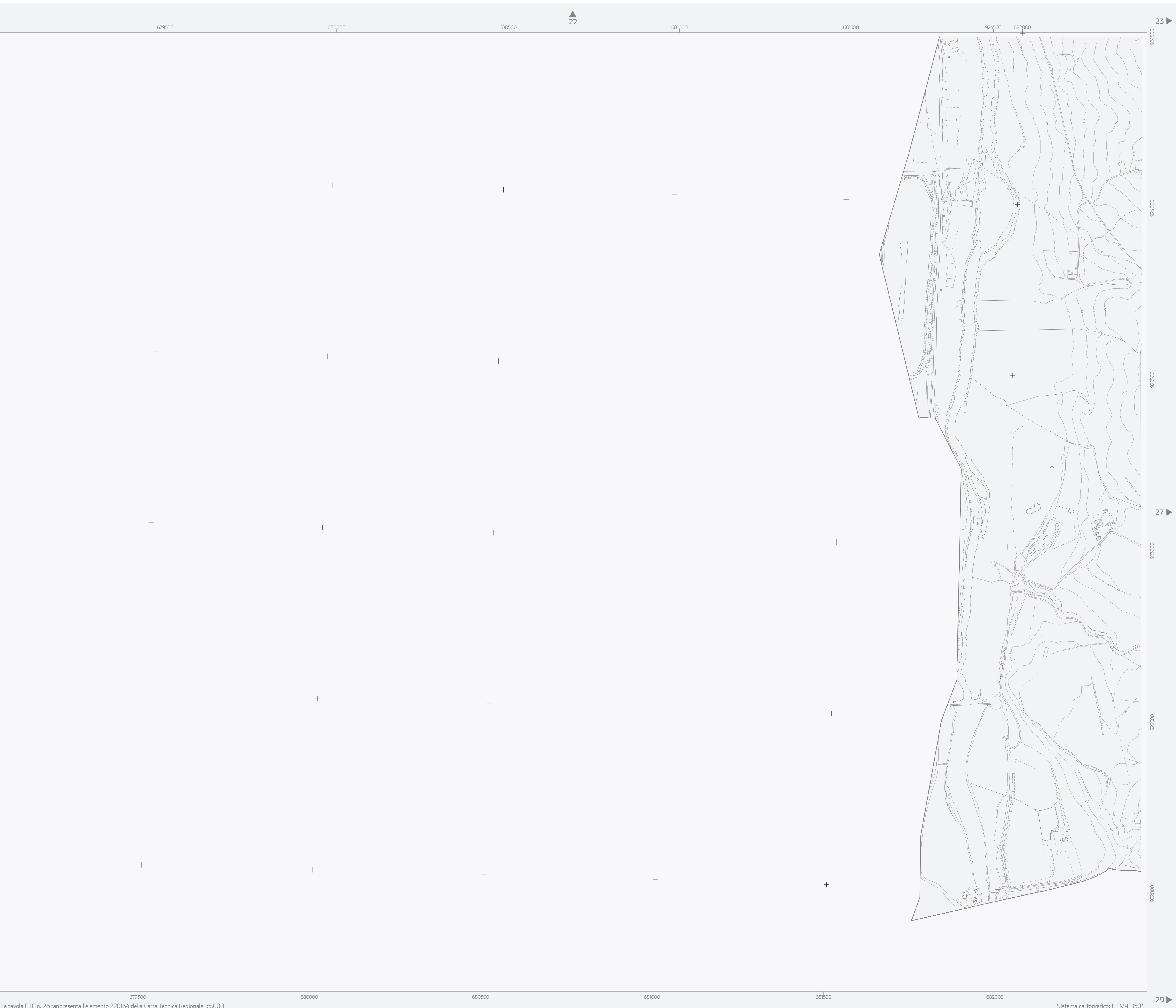
La tavola CTC n. 26 rappresenta l'elemento 220164 della Carta Tecnica Regionale 1:5.000