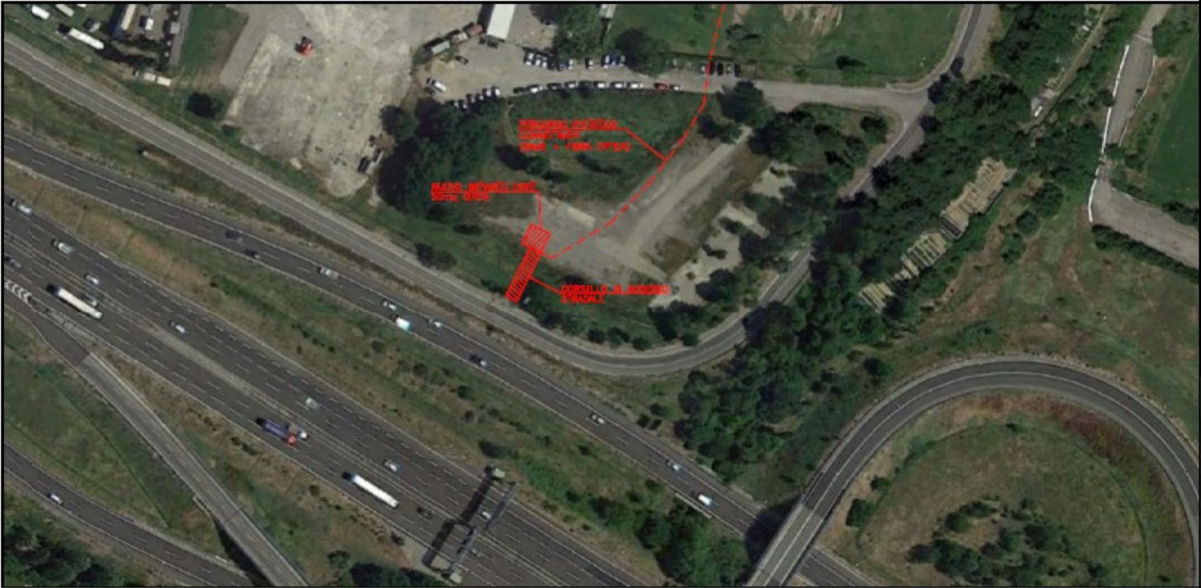
PLANIMETRIA GENERALE SCALA 1:1000